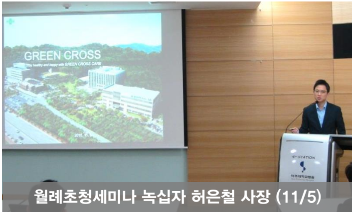
월례초청세미나 녹십자 허은철 사장 (11/5)