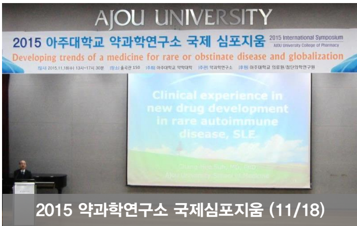
2015 약과학연구소 국제심포지움 (11/18)