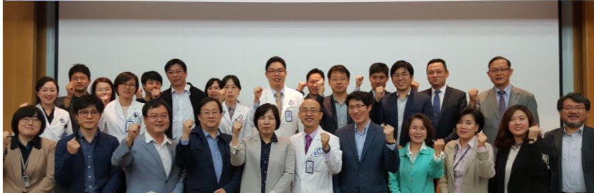
연구중심병원 육성사업 워크숍 개최(4/25)