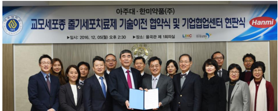
아주대-한미약품 기술이전 협약식 개최(12/9)