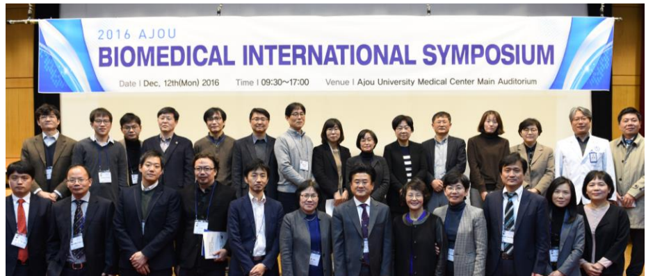
BK21-연구중심병원 국제심포지엄 개최(12/12)