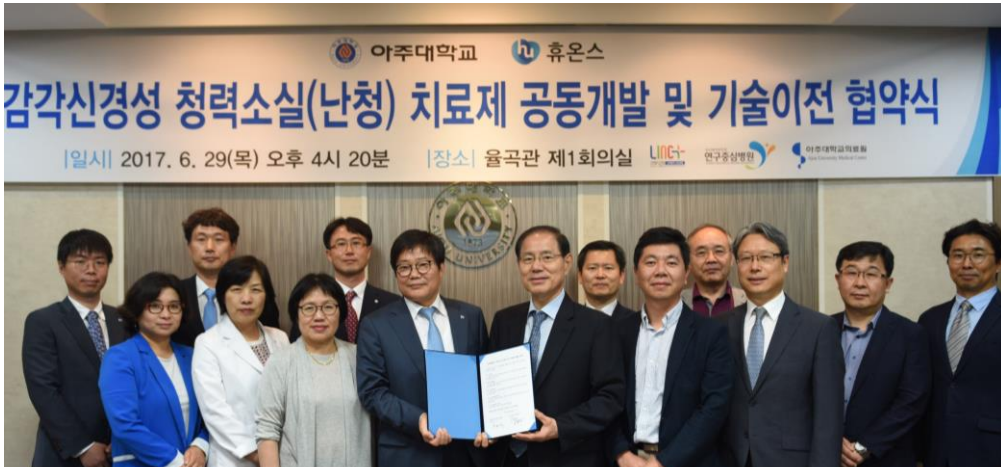
아주대-휴온스 공동개발 및 기술이전 협약식 개최(6/29)