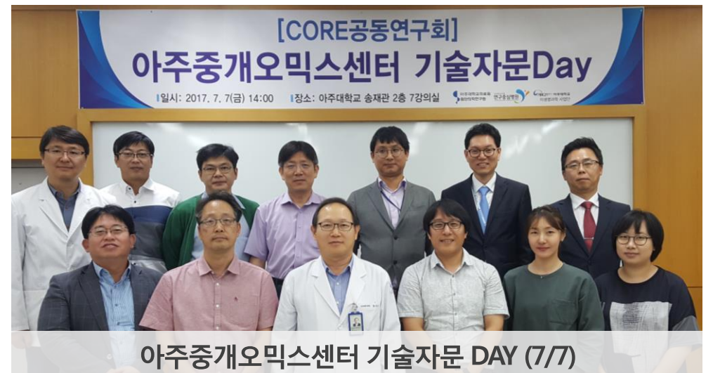
아주중개오믹스센터 기술자문 DAY (7/7)