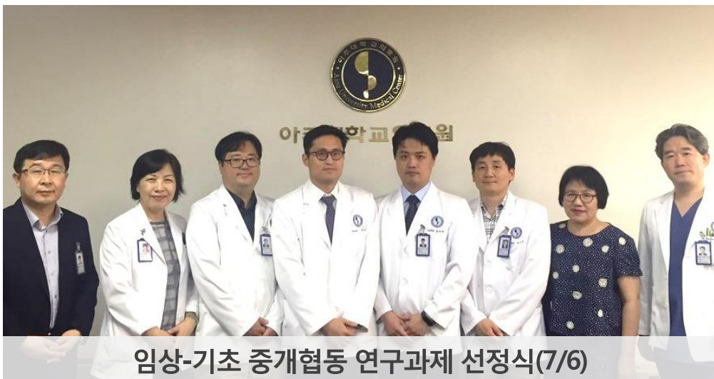
임상-기초 중개협동 연구과제 선정식(7/6)